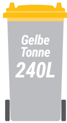
Gelbe Tonne 240 Liter