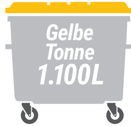
Gelbe Tonne 1.100 Liter