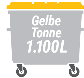
Gelbe Tonne 1.100 Liter

Abfuhrtermine siehe Kalender in der Heftmitte www.ahk-heidekreis.de