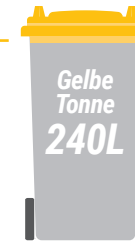
Gelbe Tonne 240 Liter

Altkleider, Batterien und Akkus, Behälterglas, Blechgeschirr, Blumentöpfe, CDs und DVDs, Druckerpatronen, Einwegrasierer, Elektrogeräte, Essensreste, Feuerzeuge, Glüh- und Energiesparlampen, Gummi, Holzwolle, Hygieneartikel, Katzenstreu, Keramik, Kinderspielzeug, Klarsichthüllen, Kugelschreiber, nicht restentleerte Verpackungen, Papier und Pappe, Papiertaschentücher, Porzellan, Rest- und Bioabfälle, Schuhe, Strumpfhosen, Styroporplatten, Tapetenreste, Windeln, Zahnbürsten, Zigarettenkippen